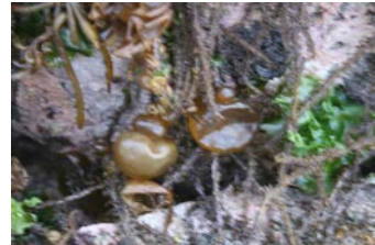
[사진 9] 물이슬

‘봉당톨’은 우도에서 ‘길이가 짤막짤막하면서도 모양이 뭉 특한 툇’을 일컫는 생활어다.