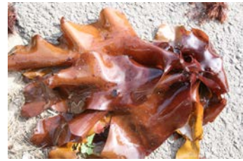
[사진 17] 멩지도박

‘멩지도박’은 도박의 한 종류다. 표준어 ‘명주도박’에 대응하는 말이다. 도박 곁이 매끈매끈하다.