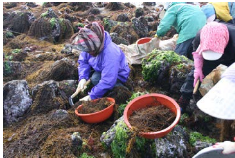
[사진 4] 톨 바다