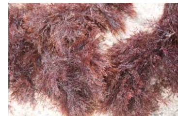
[사진 12] 섭우미

‘섭우미’는 우뚝가사리의 일종으로, 깊숙한 바다 속에서 자라는 질이 좋은 우뚝가사리를 말한다. ‘섭’은 표준어 ‘잎’에 해당하는 제주어로, 잎이 다른 우뚝가사리보다 좋아서 붙여진 이름이 아닌가 한다. 바닷속에서 가장 일찍 캔 ‘조각우미’를 달리 부르는 이름이다.