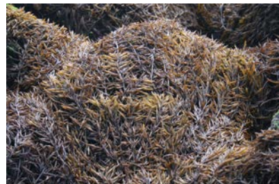
[사진 3] 툴