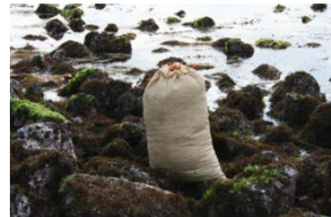
[사진 10] 툴 마다리