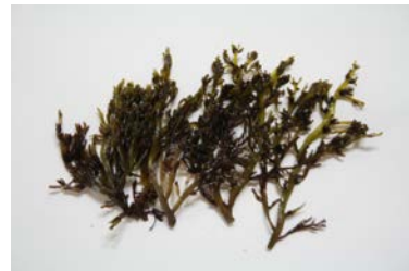
[사진 5] 서실