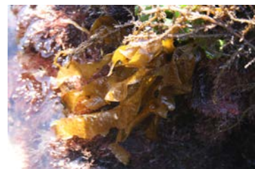
[사진 6] 메역