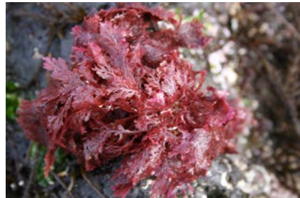
[사진 20] 헵넵이

‘헵넵이’는 바닷가 조간대 바위에 붙어사는 붉은색 해초다. 우뚝가사리 모양이나 육질이 우뚝가사리보다 부드럽다. 4~5월 우뚝가사리 채취할 때 나온다. 이용필(2008)의 《제주의 바닷말》에는 ‘엇가지풀’로 올라 있다.