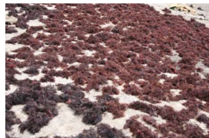
[사진 2] 우미 널다

# 우미 즈물앙 이제 으름에 먹을 거. 집에 오랑 자꾸 빨면서 널거든. 빨면서 널면은 메칠 널면은 허영케 발레지면 그게 삶아가지고 물 걸러서 하룻 밤 재 노면 그것이 튼튼해지거든. 튼튼 얼러지면 그거 반찬도 헤 먹고 우무 뺏도 행도 먹고 헐 거 주.