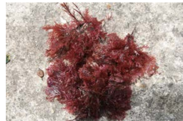
[사진 16] 고장풀

⇒ 우미 많이 나는 딘 {고장풀이} 나근에 저 하동사름덜은 {고장풀을} 막 주물 앙 풀레 가곡. 우리 동넨 우미 안 나부단 {고장풀이} 엇어. 우미에 쪼간부터온 거 그거.