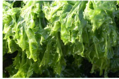
[사진 13] 개푸레

‘푸레’는 파렛과의 해조류를 말한다. 표준어 ‘파래’에 대응하는 제주어다. ‘개푸레’는 파렛과의 해조류로, 잎의 넓고 바닷가 조간대 바위에 붙어서 산다. 식용하지 않고, 거름으로 사용한다. ‘춤푸레’는 먹을 수 없는 ‘개푸레’에 비유하여 ‘먹을 수 있는 파래’를 의미한다.