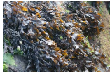
[사진 14] 넙패

⇒ 넙페 삶아근에 문대겨 방 똥장국 끌리민 그렇게 맛시잖아. 옛날 콤대산이 싱글 댕에 콤대산이 매당은에 썰어 놓국 헤 영 {넙페국} 끌리민 얼마나 맛 시냐. 고기국보다 더 맛 셔.