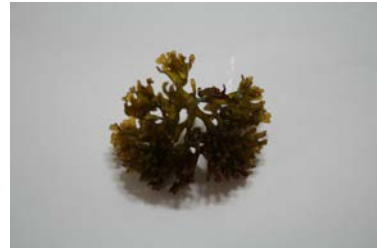
[사진 15] 막작패

바닷가 조간대 바위에 붙어사는 흑갈색 바닷말이다. 꽃상추와 같이 잎이 뭉쳐 포기를 이룬 식물이다. 패의 일종이다.