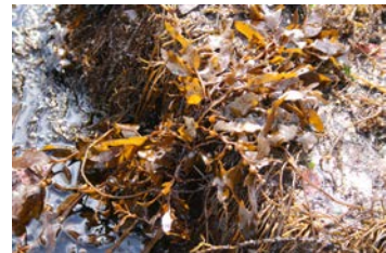
[사진 8] 뚫북