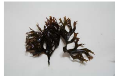
[사진 18] 지꺼리

‘지꺼리, 지끄리’는 바다 풀의 일종으로, 바위에 붙어 산다. 넓패와 모양이 비슷하나 작다고 한다.