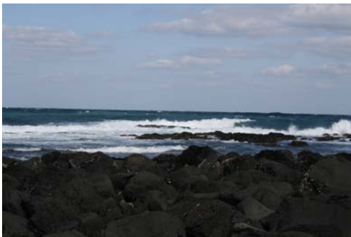
[사진 1] 우도 바당

유네스코는 2010년 12월 제주어를 ‘소멸 위기의 언어’ 가운데 4단계인 ‘아주 심각하게 위기에 처한 언어’(critically endangered language)로 분류하였다. 이는 바다를 생업으로 살아온 사람들의 어휘도 소멸 위기에 놓여 있다는 증거다. 조사자가 어촌 생활어 가운데 섬 언어에 관심을 가지는 이유는, 그나마 바다를 생업으로 활동하는 지역에서의 어촌 생활어가 많이 남아 있을 것이라는 판단에서다. 그러나 본