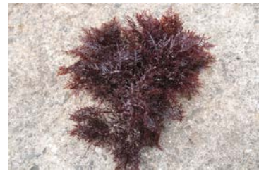
[사진 11] 돌우미

‘돌우미’는 우뚝가사리의 일종으로, 바닷가 바위 위에 자라나는 자잘한 우뚝가사리를 우도에서 일컫는 말이다.