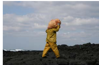
[사진 7] 마중허다

‘마중’은 잠녀들이 채취한 해초와 해산물을 바닷가 밖으로 나르는 일을 말한다. 보통 마중은 물질하는 잠녀의 남편과 가족들이 한다. 잠녀들이 채취한 해산물을 밖으로 나르는 일을 ‘마중질허다’ 또는 ‘마중허다’라고 한다. 제주 서쪽에서는 이를 ‘풍중허다’라고 달리 표현한다. 우도에서 예전에 마중질을 할 때는 지계에 발채를 올려놓고 잠녀들의 채취물을 밖으로 지내었다면 지금은 어깨에 매어 옮긴 후 트럭을 이용하여 운반한다.