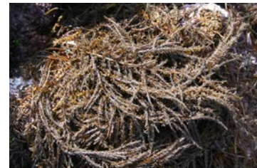
[사진 19] 지충

‘지충’은 툇이 자라는 조간대 바위에 붙어사는 해초다. 이용필(2009)의 《제주의 바닷말》에는 식물명이 ‘지충이’로 올라있다.